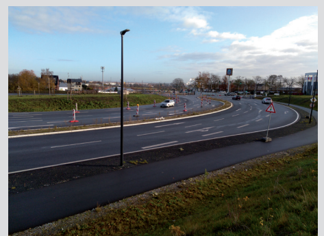
Vorläufiger geplanter Bauablauf B 265n, OU Hürth-Hermülheim